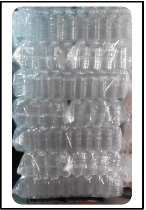
Foto Producto por empaque