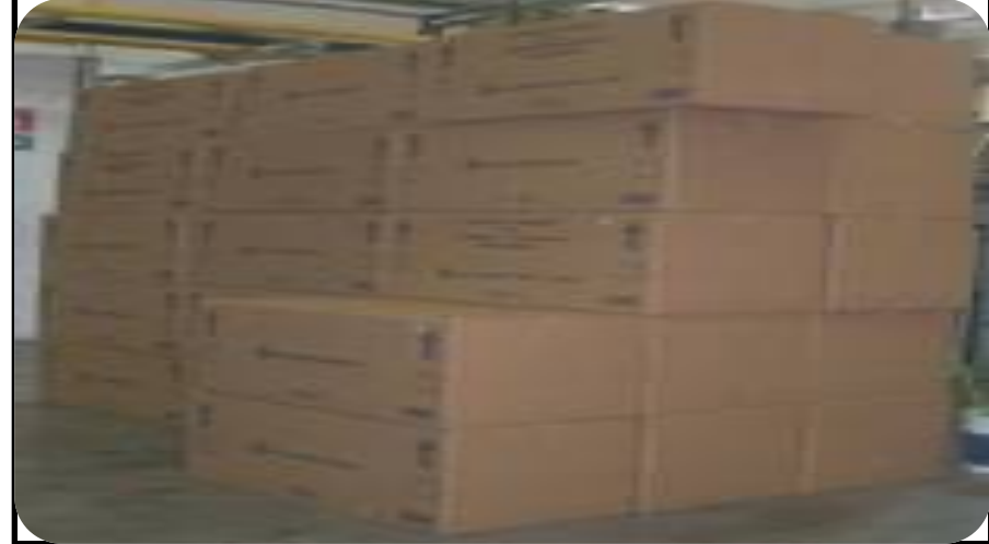
Foto Producto por empaque