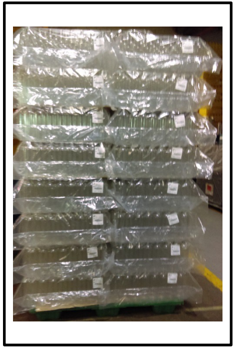
Foto Producto por empaque