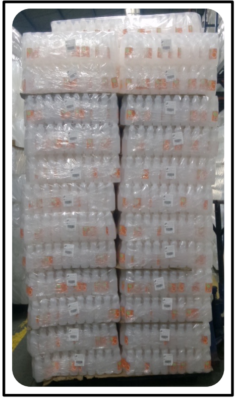
Empaque de producto