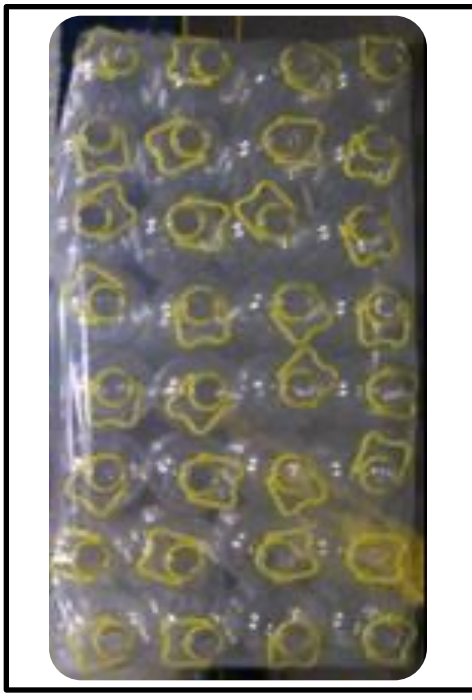
Foto Producto por empaque