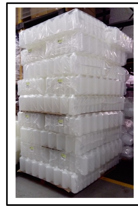
Foto acomodo por empaque