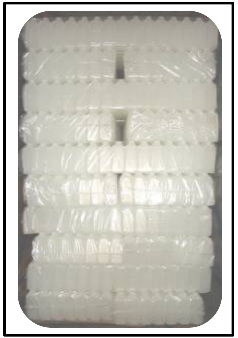
Foto Producto por empaque