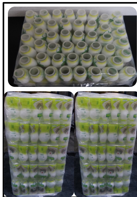
Foto Producto por empaque