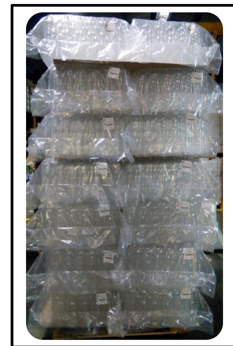
Foto Producto por empaque