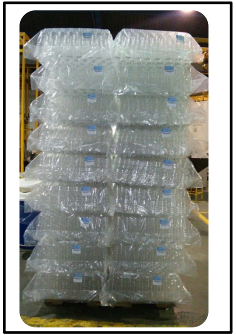
Foto Producto por empaque