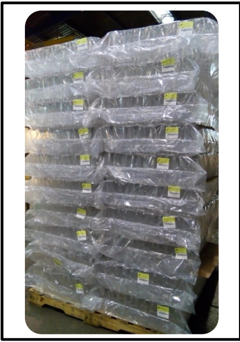
Foto Producto por empaque